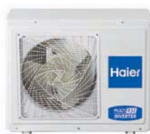
1:3 3U55S2SR2FA 3U70S2SR2FA