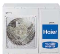
1:4 4U75S2SR2FA 4U85S2SR2FA