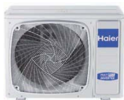
1:5 5U90S2SS2FA 5U105S2SS3FA